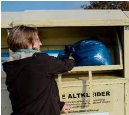
Altkleider werden im Container entsorgt

Schon im 7. Jahrgang starteten die Kinder zuvor mit ersten beruflichen Erfahrungen. Die Werkstatttage bilden zusammen mit der Potenzialanalyse, verschiedenen individuellen Herausforderungen, zwei Berufspraktika, Beratungsterminen in der Agentur für Arbeit, Betriebsbesichtigungen und Messebesuchen einen Teil der